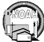
Erlöserkirche St. Mariae-Jacobi Christuskirche St. Marien Hl. Dreifaltigkeit Noah